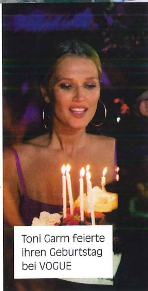
Toni Garn feierte ihren Geburtstag bei VOGUE