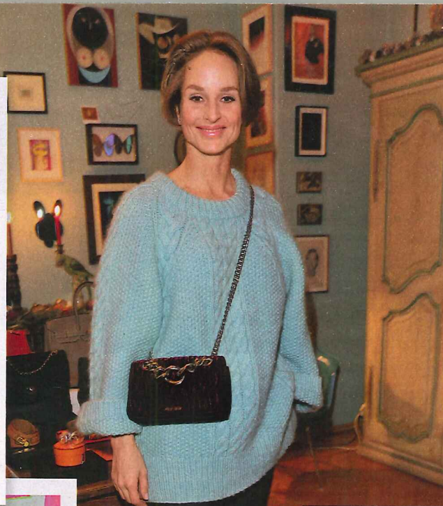
Netz- werkerin: Schauspie- lerin Lara Joy Körner