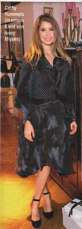
Cathy Hummels (in einem Kleid von Issey Miyake)