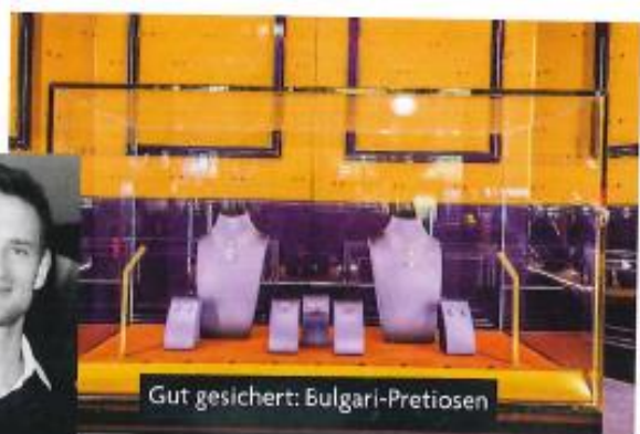
Gut gesichert: Bulgari-Preziosen