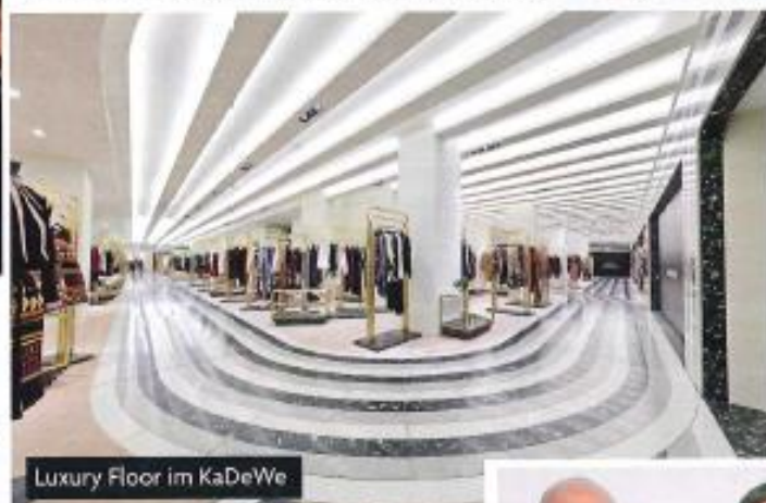
Luxury Floor im KaDeWe