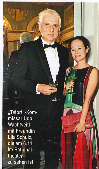
„Tatort“-Kommissar Udo Wachtveitl mit Freundin Lilla Schulz, die am 6. 11. im Rationaltheater zu sehen ist