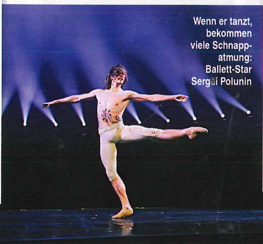
Wenn er tanzt, bekommen viele Schnappatmung: Ballett-Star Sergei Polunin